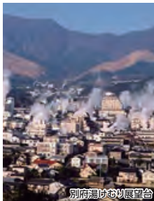
別府湯けむり展望台