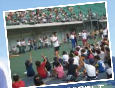
運動会で1等賞を目指して 専門指導員による陸上教室開催

雄大な大自然と、くじゅう連山に囲まれた標高1,000メートルの九重(このえ)・飯田高原。夏の気温は平均20℃と涼しく、トップアスリートも利用する絶好のスポーツ環境が整っています。そんな大自然を舞台に、陸上教室&早朝マラソンを実施します。さわやかな高原の風を浴びて心と身体をリフレッシュ。豊かな観光資源も巡る充実のツアーです。親子の絆を深める。夏休み最後の思い出に…。ぜひご参加下さい。