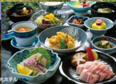
*写真はすべてイメージです