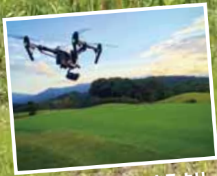
ドローン体験もできるよ!!