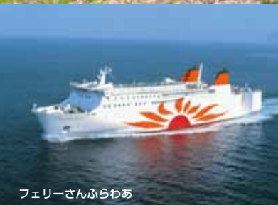
フェリーさんふらわあ