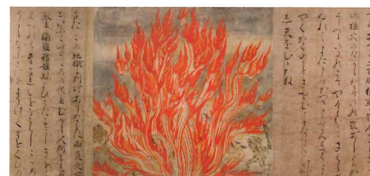
上:東洲斎写楽(市川観藏の竹村定之進)江戸時代 寛政6(1794)年 重要文化財 下:《地獄草紙》平安時代(12世紀) 国宝

東京国立博物館の所蔵品の中より、縄文時代から江戸時代まで、各時代の名品を一堂に紹介します。縄文土器や埴輪から、江戸時代の若冲や北斎まで、日本美術の流れを、国宝や国指定の重要文化財などをまじえた貴重な作品でとどります。日本の芸術、文化に通底する特質や、美意識をふり返るとともに、本展がこれからの文化継承とさらなる発展について考える契機となることを願い、開催いたします。