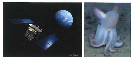
左:小惑星探査機「はやぶさ2」旅立ち イラスト:池下 章裕 右:深海の生物 ジュウモンジダコ

国立研究開発法人宇宙航空研究開発機構(以下、JAXA)と国立研究開発法人海洋研究開発機構(以下、JAMSTEC)の全面的な協力のもと、「未知への挑戦~夢を追う人々~」をテーマとして、実際のロケットエンジンをはじめ、ロケットや調査船の大型模型や小惑星や深海の映像により、生活圏の拡大、深海へ宇宙へ、そして、生命の起源、深海か宇宙かという研究成果を紹介。最先端の科学技術への関心や未知への探究に思いを馳せる契機となることを願い、開催いたします。