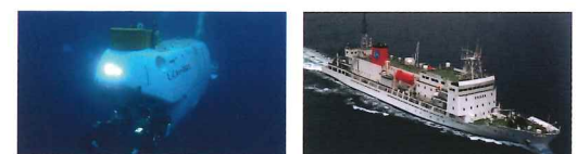
左:有人潜水調査船「しんかい6500」 ©JAMSTEC 右:深海潜水調査船支援母船「よこすか」 ©JAMSTEC

【日時】10/13日(土)・10/14日(日)(びびり先行)10:00~11:00、(一般)11:00~16:00 【場所】別府国際観光港第4埠頭/別府市北石垣1999 【定員】大分県芸術文化友の会 びびり有料会員 300名(各日共通)、一般 定員制限なし 【参加費】無料(10:00~11:00の大分県芸術文化友の会 びびり有料会員優先見学会は要事前申込)