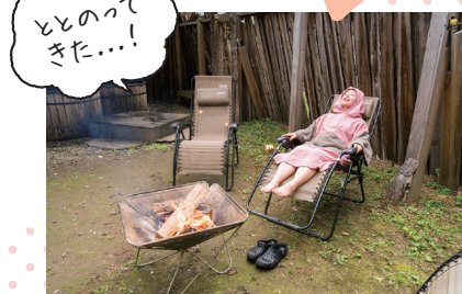
休憩スペースのイスで 焚き火の前にととのいます