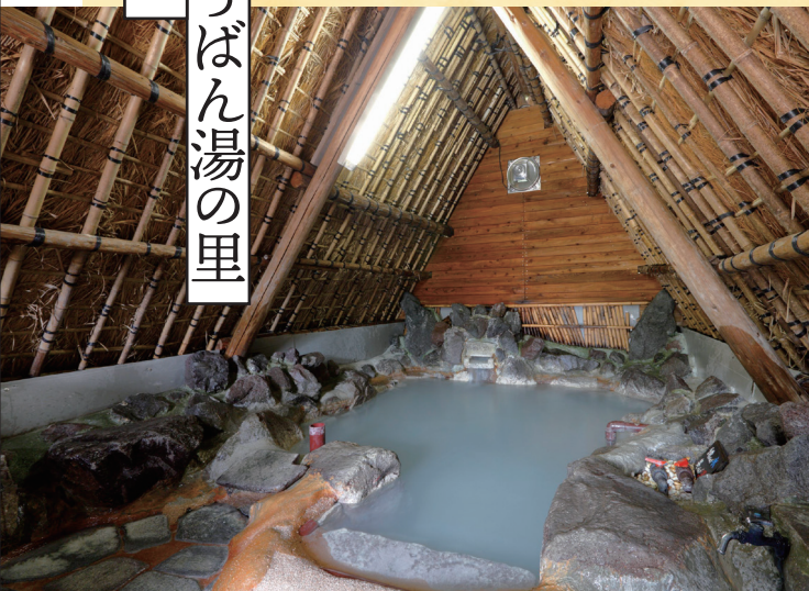
↑ 「薬用 湯の花」の製造技術は国の重要無形文化財!