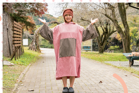
ポンチョとサウナハットを貸し出してくれます