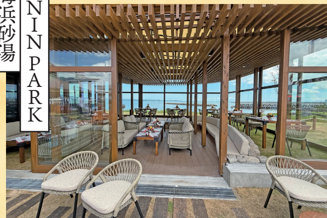
↑ 施設内にあるレストラン『Grill Takka』

所 別府市上人ヶ浜町795-1 SHONIN PARK内 TEL 0977-75-6360 営 8:00~22:00(最終受付 21:00) 料 2500円、小学生1800円、小学生未満は利用不可(砂湯・大浴場・浴衣・バスタオル付き) 休 不定(月2回) P 104台 交 別府ICから車で約15分 HP: https://www.shoninpark.jp/ MAP: https://x.gd/vwbqA