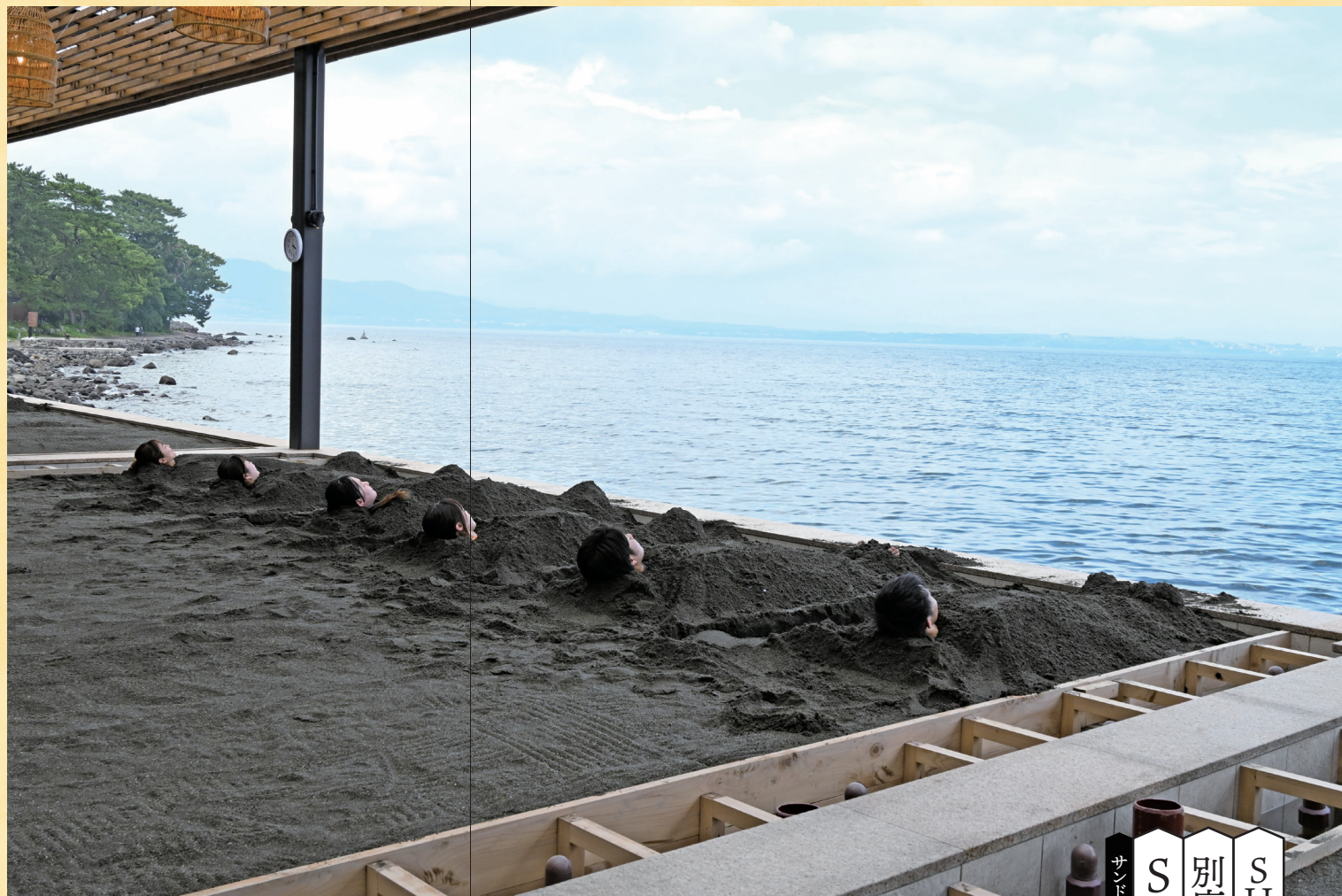
↑ 平安時代から続く「砂湯」が現代風にリニューアル

所 別府市鉄輪上1組 TEL 0977-67-3880 営 早朝7:30~19:30(最終受付19:00) 休 第4木曜※祝日の場合は営業、翌日休み 料 700円(浴衣は+220円、Tシャツ短パン持参可能)、足蒸しは無料 P 提携P利用(2時間無料) 交 別府ICから車で約10分 IG: https://www.instagram.com/kannawa_mushiya/ MAP: https://x.gd/BIQke