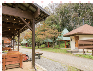
川遊び、BBQ、ラフティングなどが 楽しめる自然豊かな宿泊施設

●詳細はこちら https://teppan-oita.jp/tour/naba-sauna/