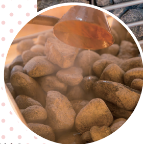
ロウリュ用のアロマ マ水で、室内が いい香りに