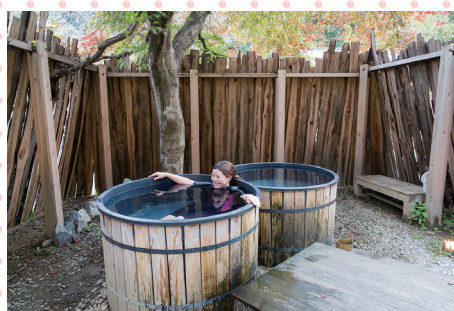
しっかり体を温めたら 水風呂へ！