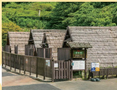
↑ 全国的にも珍しい、わら葺き屋根の貸切湯

創業300年の歴史を誇る『みょうばん湯の里』で楽しめるのは、肌に溶け込むような乳白色の湯が特徴の硫黄泉。湯の花小屋を模したわら葺き屋根の外観の4棟の貸切湯があり、岩風呂の湯船の中で足を伸ばしてくつろげます。独特の風情があり、子どもも喜びそうな非日常感が味わえるので、家族で訪れるのもおすすめです。