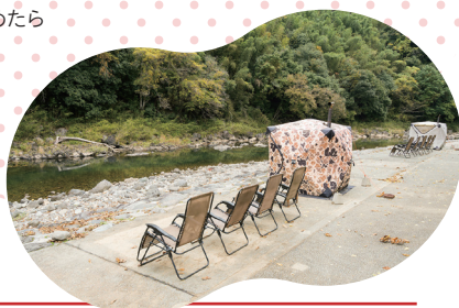
奥岳川の清流を水風呂として利用するのOK。テントサウナもあります