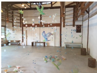
椎原由紀子 / インスタレーション《創造の旅へ》