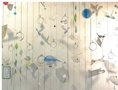
椎原由紀子 / 個展風景「風そよぐ、ぬのこぼ展」より