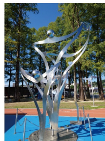
芝田知明 / 《心ひとつ》