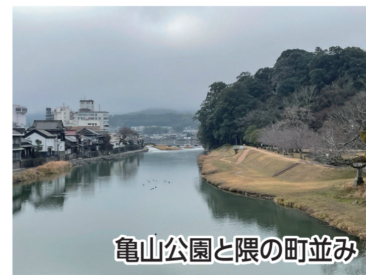
亀山公園と隈の町並み