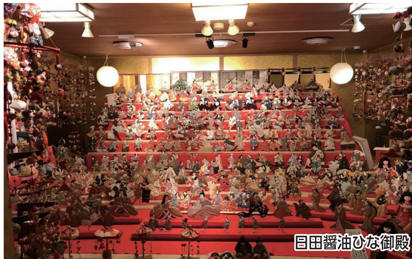
日田醤油ひな御殿