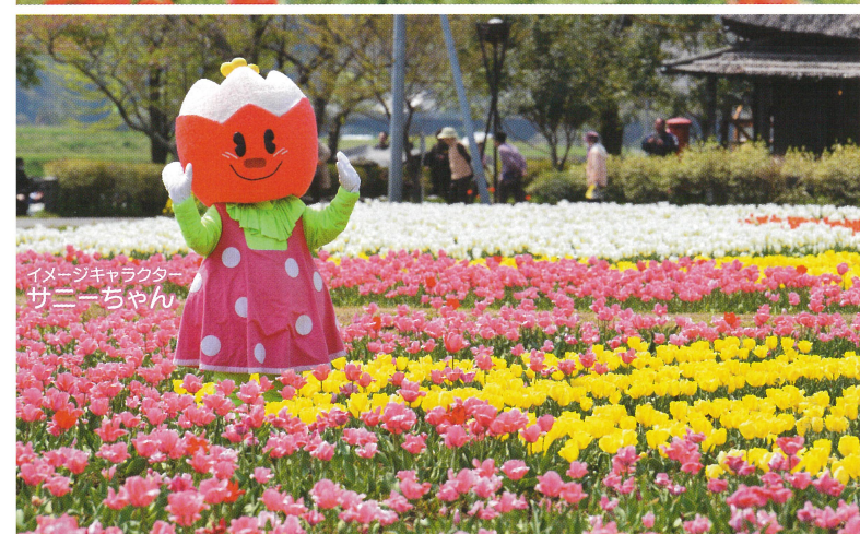
イメージキャラクター サニーちゃん