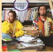
ザ・キャビンカンパニー