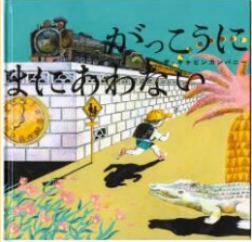
絵本「かっこうにまよとあわなない」 2022年(あかね書房)