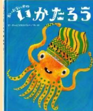
絵本「だいういかのいかたろう」 2014年(鈴木出版)

6月11日(日) お支払い金額 大人 6,800円 高校・大学生 6,000円 中学生以下 5,200円 7月15日(土) (※全国旅行支援対象) 地域クーポン 1,000円分付 (旅行代金 大人 8,500円 高校・大学生 7,500円 中学生以下 6,500円)