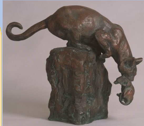
朝倉文夫《よく獲たり》(1946年)大分県立美術館蔵

朝倉文夫生誕140周年記念 猫と巡る140年、そして現在 会期：6月9日(金)～8月15日(火) 大分県立美術館 1階 展示室A・アトリウム