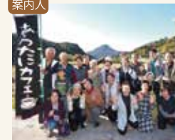
案内人 あらたに会の皆さん

【参加料】2500円【集合場所】上国崎地区公民館(国東町見地1253番地1)【定員】15名(最少催行2名)【持ってくる物】エプロン、三角巾、タオル、持ち帰り用袋(大ジップロック等)【行程】9:30開始・説明→こんにゃく作り→12:00昼食→13:30終了