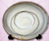
「しんけん大分学検定」特製 小鹿田焼 郷土料理本