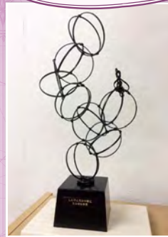
最高得点者に贈られる 特製竹トロフィー「湯けむり」 (竹田市在住の竹藪家・中臣一氏製作)