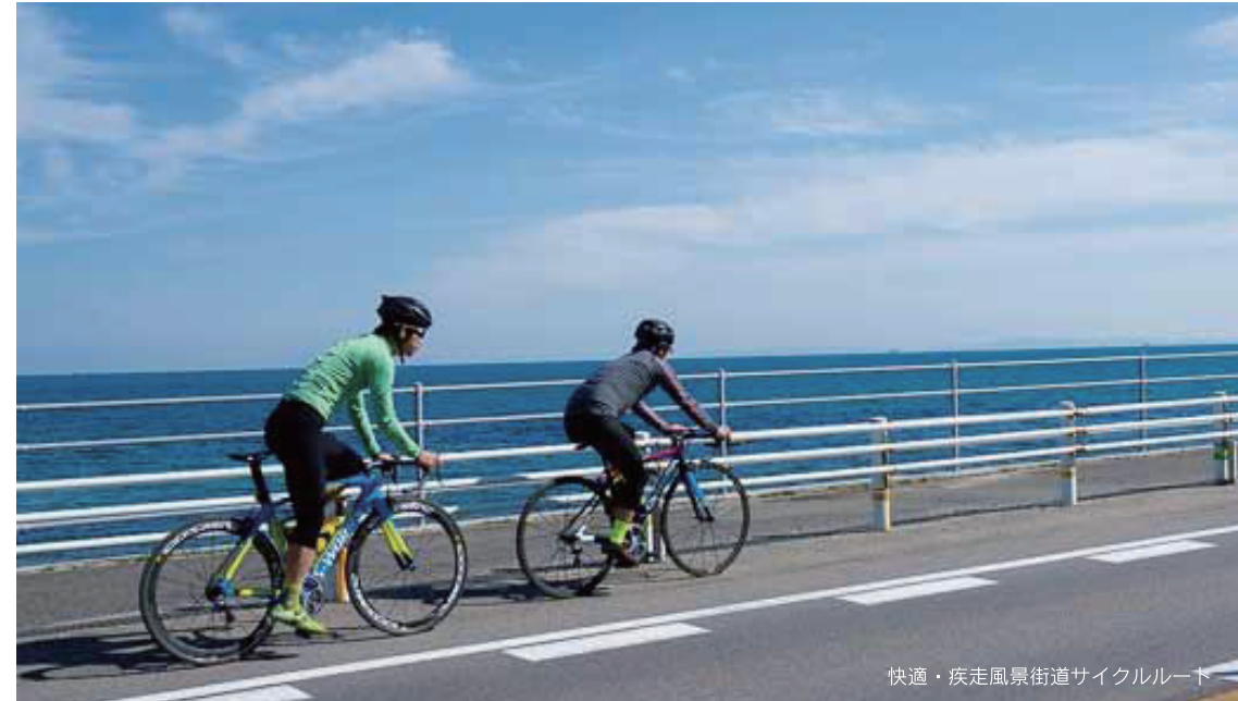
快適・疾走風景街道サイクルルート