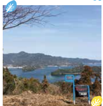
遠見山山頂の展望所は360度の大パノラマ 春には桜の花が満開になる