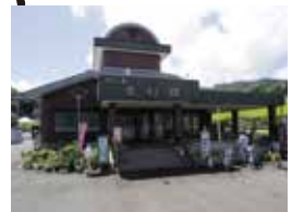
食事・弁当を販売している