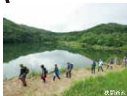
世界農業遺産の代表的スポット