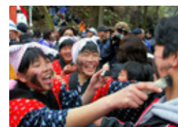
木浦の墨付け祭り（冬）