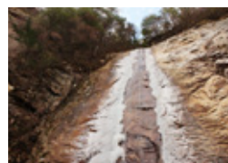
藤河内溪谷の水瀑（冬）