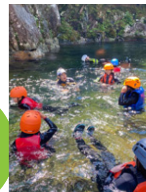
キャニオニング（夏）