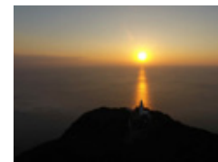
九州最東端の初日の出