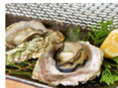
岩ガキまつり (5月下旬 ~ 8月)