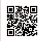
しらす料理の豊洋丸