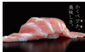
佐伯市産黒マグロ (不定期でフェアを開催しています)